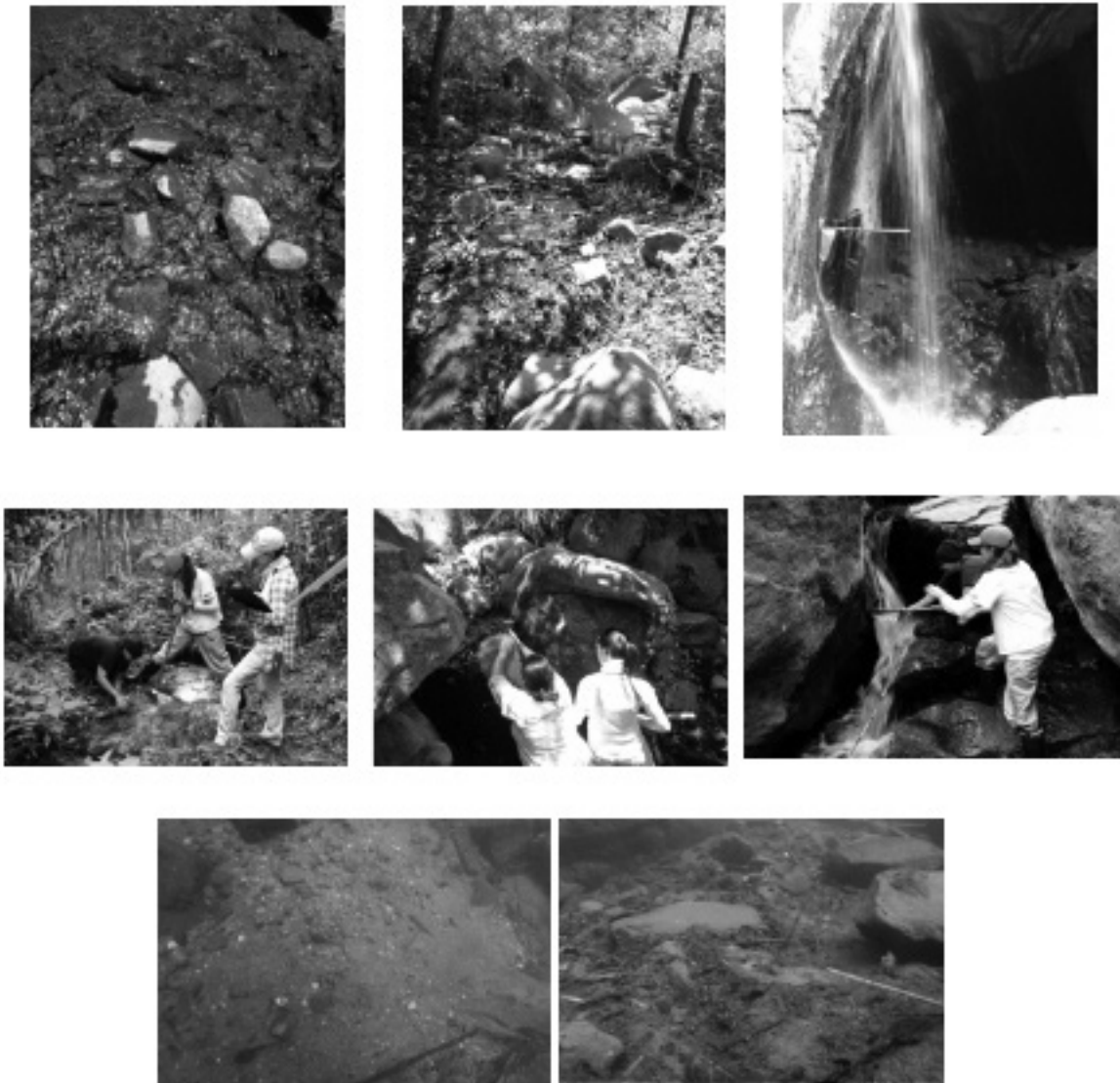
Figura 2. Microhábitats seleccionados. Arriba: piedras o guijarros, hojarasca, musgo. Centro: vegetación acuática, roca o peña, catarata. Abajo: grava o cascajo y pozas.

el arrastre de los organismos de un sitio a otro, lo cual es propio de la temporada lluviosa (Brown & Brussock, 1991; Reyes-Morales & Springer, 2014). Se seleccionaron ocho tipos de microhábitats: hojarasca, grava o cascajo, piedras o guijarro, roca o peña, musgo, vegetación acuática, pozas y cataratas (Tabla 1, Figura 2).