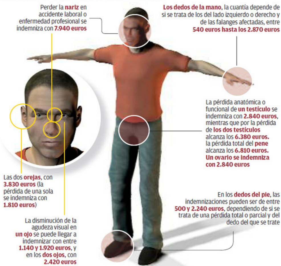
Figura 1. Costos de algunos accidentes laborales en la Comunidad Europea.

REVISIÓN DE LAS CIFRAS QUE RIGEN DESDE EL PASADO 1 DE ENERO