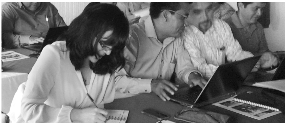
Figura 7. Profesionales docentes del Centro Universitario de Sololá en la elaboración de los objetivos estratégicos.