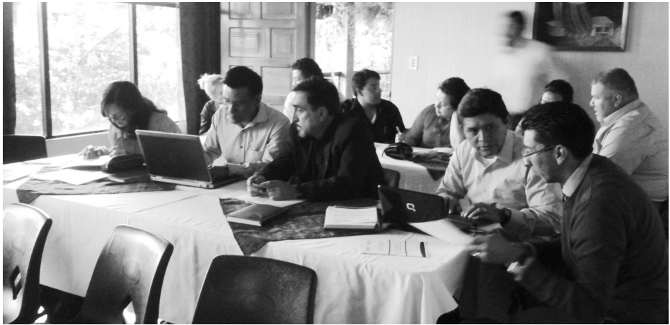
Figura 3. Profesionales docentes del Centro Universitario de Sololá en la elaboración de las fortalezas y oportunidades.