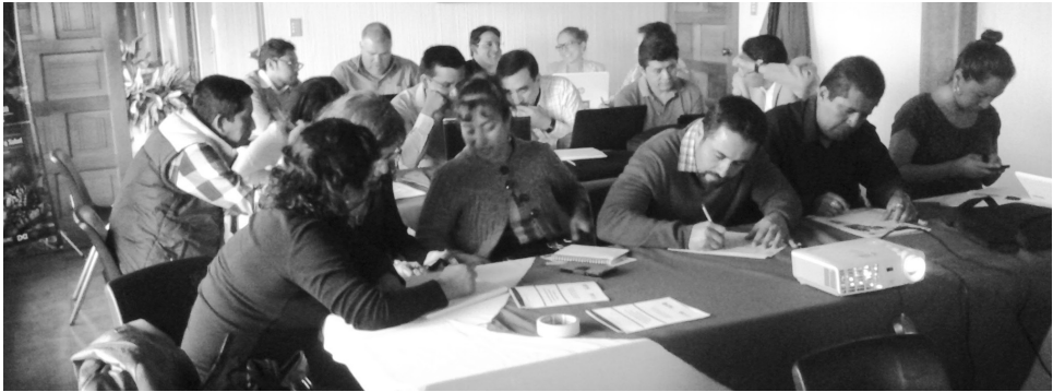
Figura 8. Profesionales docentes del Centro Universitario de Sololá en la elaboración de los objetivos estratégicos.