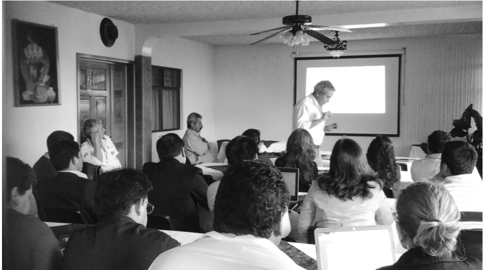
Figura 1. Profesionales docentes del Centro Universitario de Sololá en la elaboración del proyecto del Centro de Investigaciones Generales.

1) Aprobar la creación del Centro Universitario de Sololá de la Universidad de San Carlos de Guatemala.