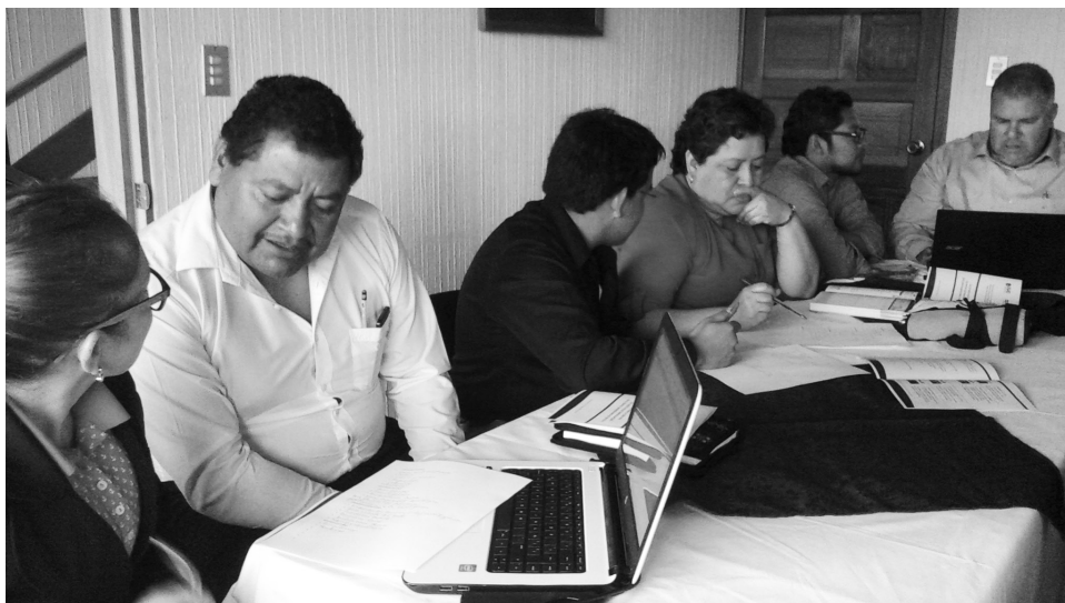
Figura 2. Profesionales docentes del Centro Universitario de Sololá en la elaboración del proyecto del Centro de Investigaciones Generales.