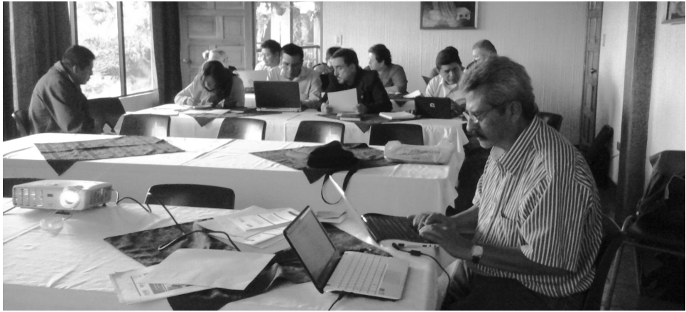
Figura 5. Profesionales docentes del Centro Universitario de Sololá en la elaboración de la misión y visión del Centro de Investigaciones Generales.