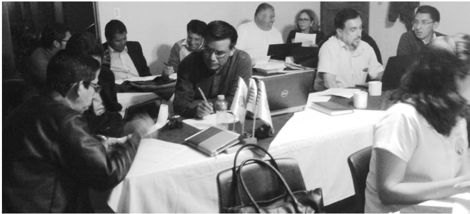
Figura 4. Profesionales docentes del Centro Universitario de Sololá en la elaboración de las debilidades y amenazas.