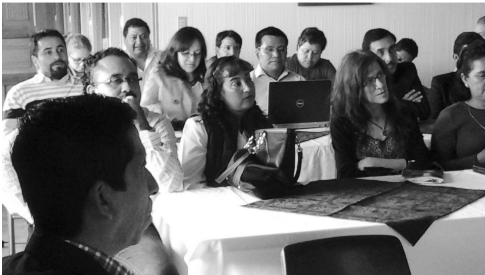
Figura 6. Profesionales docentes del Centro Universitario de Sololá en la elaboración de los objetivos estratégicos.