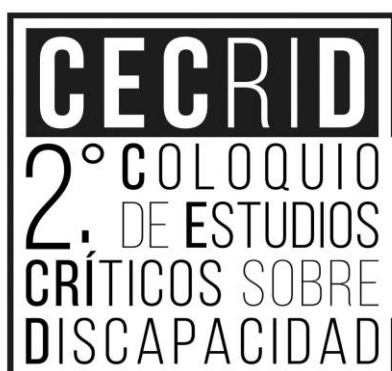
Logo de la segunda edición del CECRID.

Las dos ediciones del CECRID han tenido como sede la Escuela Nacional de Trabajo Social (ENTS) y el Instituto de Investigaciones Antropológicas (IIA), respectivamente, ambas instancias pertenecientes a la UNAM. La primera edición se realizó el 21, 22 y 23 de mayo del 2018 y estuvo conformada por 6 conferencias magistrales, 18 mesas temáticas que albergaron a un total de 70 ponencias. La segunda edición se realizó el 21, 22 y 23 de agosto y se conformó por 2 conferencias magistrales 22 , 2 foros temáticos (uno sobre salud mental