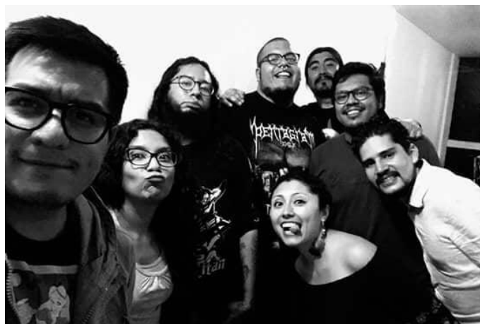
Colectivo La Lata previo al CECRID 2018.

En los siguientes apartados desarrollaremos brevemente cada una de las tres