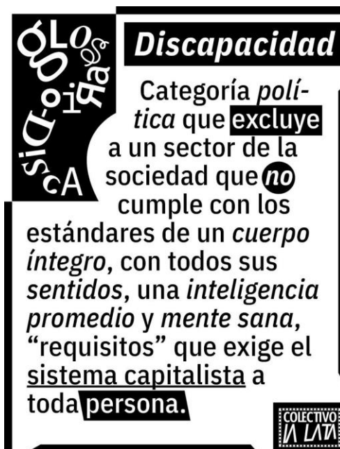
Primera entrada del Glosario Disca, agosto del 2019.

Uno de los conceptos que hemos estado debatiendo y reflexionando en el colectivo o conjuntamente con otras personas o colectividades con las que estamos generando complicidades es: capacitismo, el cual nos sirve para comprender muchas de las dinámicas políticas, económicas, sociales y culturales que conforman la discapacidad y determinan la forma en que se constituye la sociedad en el capitalismo neoliberal. El concepto tiene su origen en las academias del Norte global y es poco conocido en nuestro contexto, debido a su importancia consideramos indispensable socializar lo que sabemos de él ya que nuestra postura es anticapacitista.