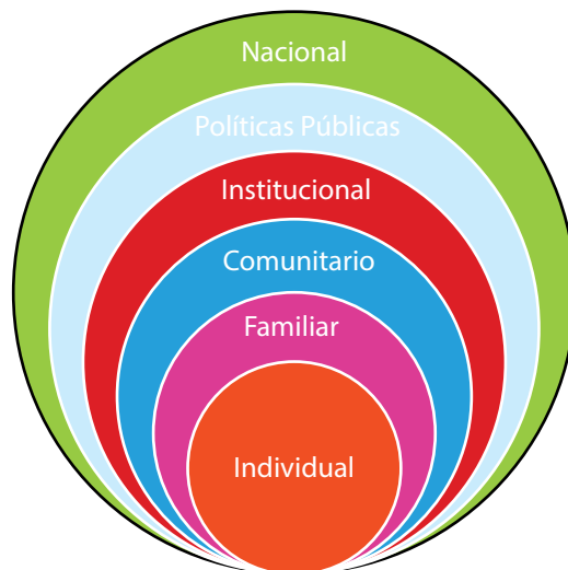
ILUSTRACIÓN 3: NIVELES DE INFLUENCIA PARA LA COMUNICACIÓN EXTERNA