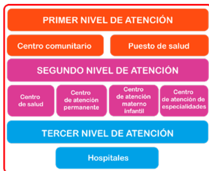
ILUSTRACIÓN 2: NIVELES DE ATENCIÓN DE SALUD