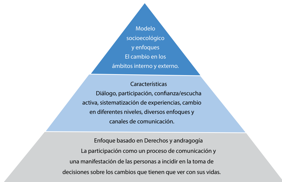
ILUSTRACIÓN 5: SECUENCIA DE LA COMUNICACIÓN PARA EL CAMBIO SOCIAL Y DE COMPORTAMIENTO DE LA ESTRATEGIA NACIONAL DE SALUD DIGITAL EN GUATEMALA