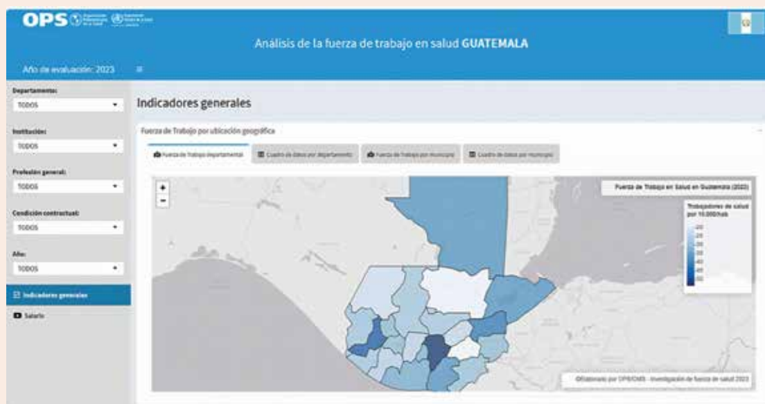
Figura 1 Análisis de la fuerza de trabajo en salud. Guatemala, 2023.