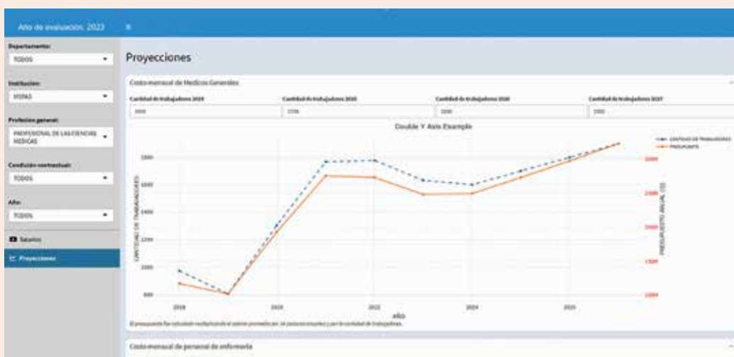
Figura 4. Proyecciones. Costo mensual de Médicos Generales. Guatemala, 2023