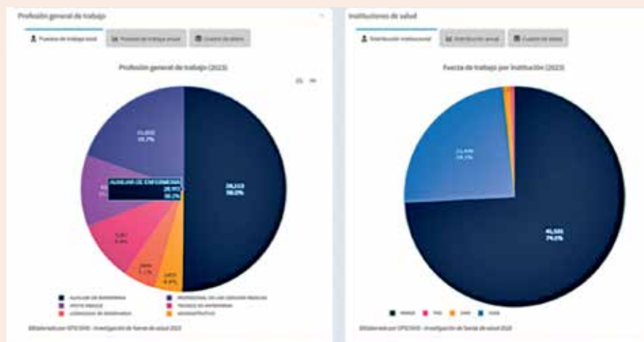
Figura 6. Profesión general de trabajo. Guatemala, 2023.