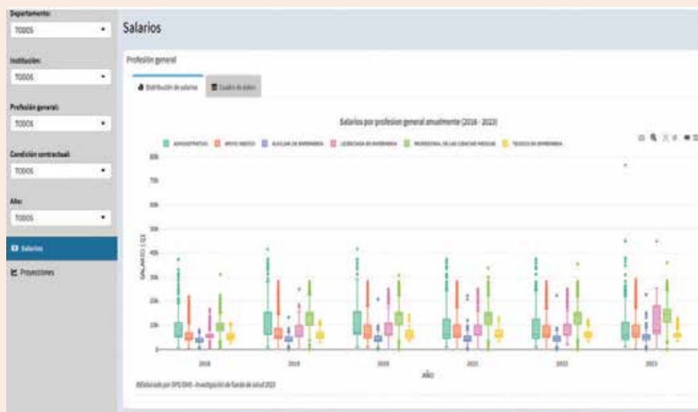
Figura 3 Salarios por profesión general anualmente (2018-2023). Guatemala, 2023