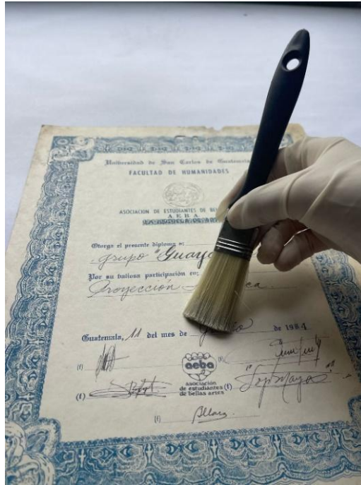
Ilustración 1. Fotografía que muestra la forma en que se realizó la limpieza mecánica de los documentos.