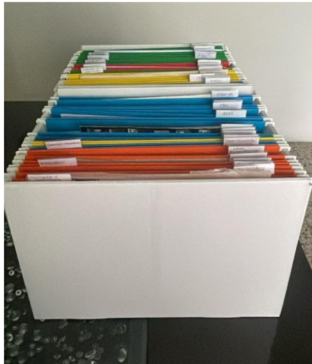
Ilustración 4. Fotografía que muestra el resultado final de orden y embalaje de los documentos de Archivo Histórico del grupo Guayacán.