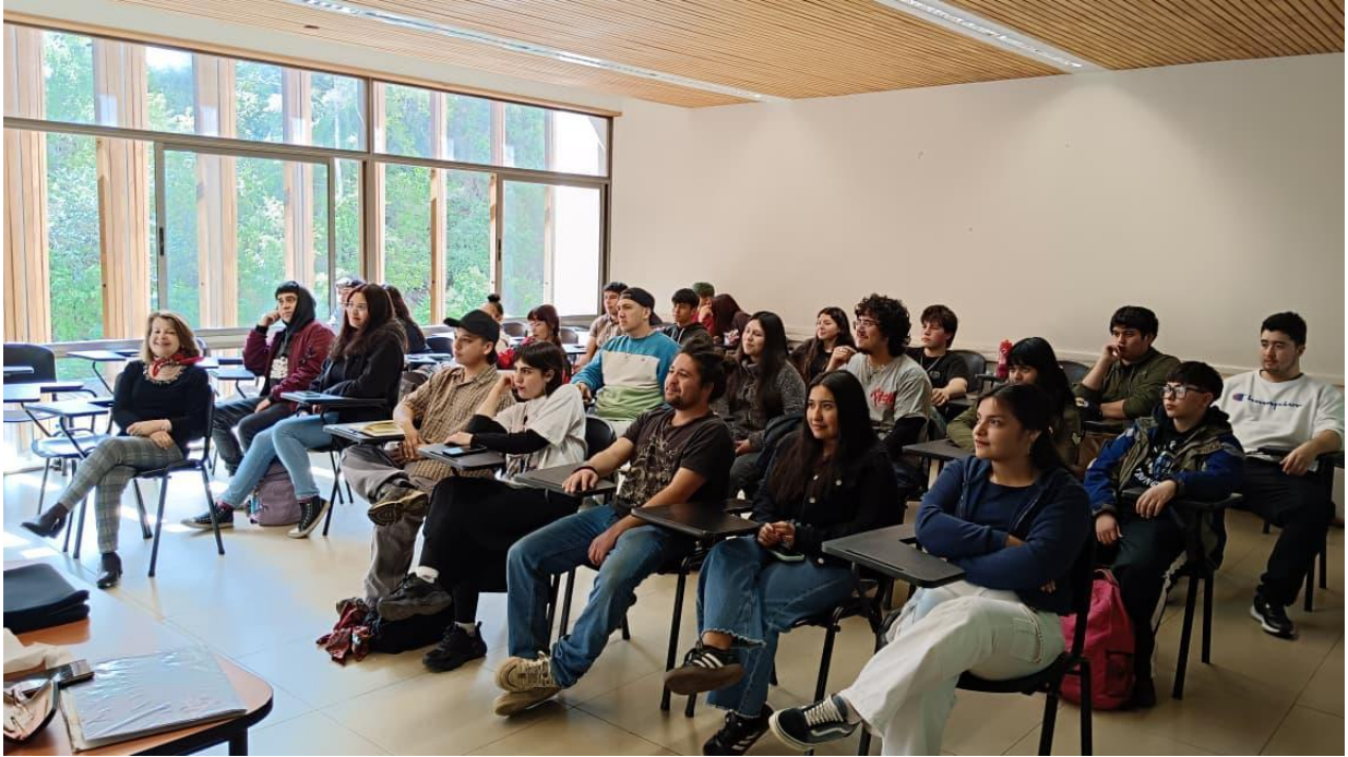
Ilustración 8. Fotografía del grupo de estudiantes del curso Música y danza de la Universidad Católica de Temuco durante la transmisión en vivo del concierto didáctico.