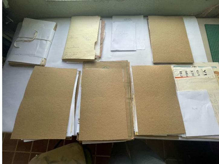
Ilustración 3. Fotografía que muestra la forma en que se clasificaron la documentación de archivo.