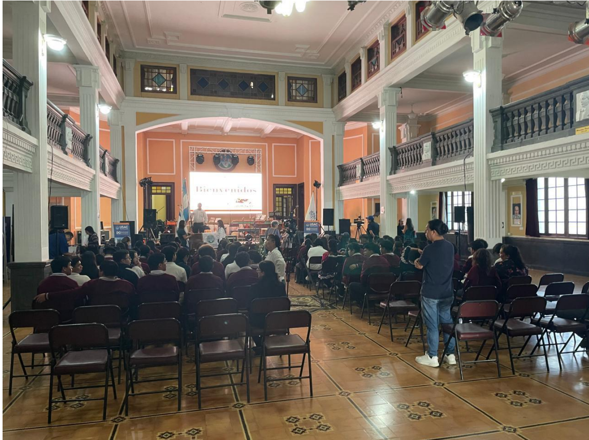
Ilustración 6. Fotografía tomada durante el Concierto Didáctico, del 26 de septiembre de 2025 realizado en el auditorio del Centro Cultural Universitario, Antiguo Parainfo. En la misma se aprecia de espaldas a los estudiantes de la ENMEM "José María Alvarado".