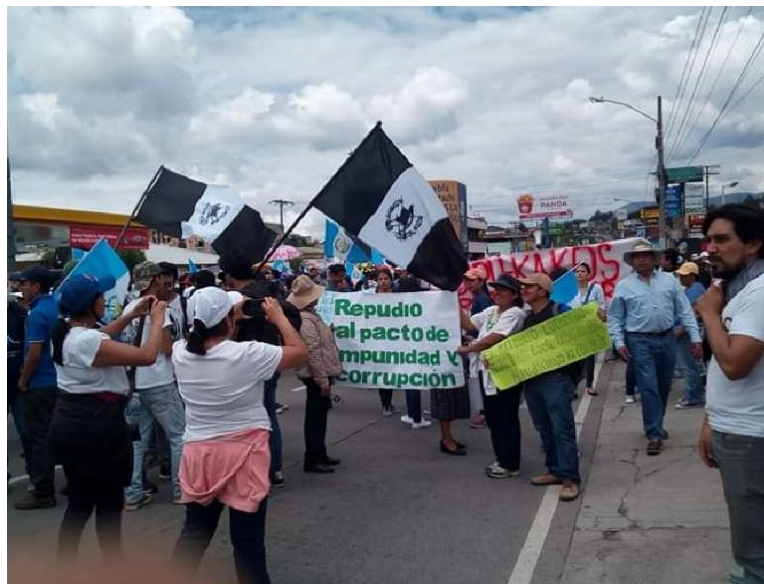
Figura No. 3 Marcha 20 S, septiembre 2018, Quetzaltenango

Vemos entonces que el suroccidente de Guatemala ha sido escenario de grandes movimientos sociales campesinos, indígenas, de mujeres que han buscado la reivindicación de derechos, han manifestado su descontento ante las injusticias y violación de derechos ante la ausencia de un Estado fallido que invisibiliza la problemática de estos sectores de la población. Esto movimientos sociales con múltiples demandas y objetivos sectoriales, no son excluyentes entre sí, pues todos caminan hacia la búsqueda de la igualdad y justicia.