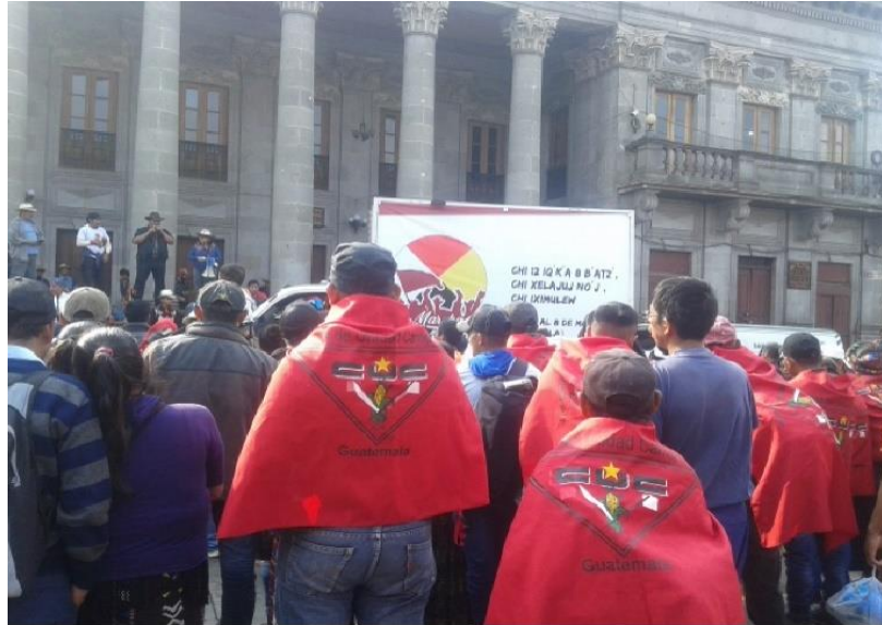
Figura No. 1 Marcha por la dignidad y justicia. Quetzaltenango, 30 de abril 2019.