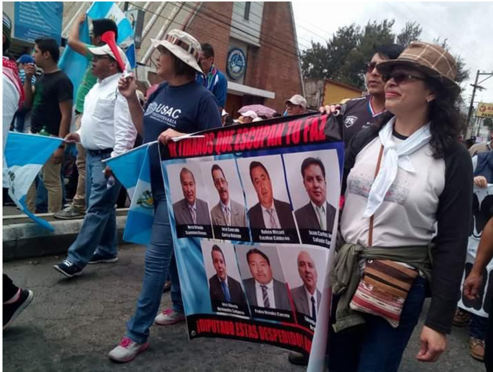
Figura No.8 Manifestación Ciudadana. 2015. Docentes

Universitarias de la Carrera de Trabajo Social CUNOC-USAC