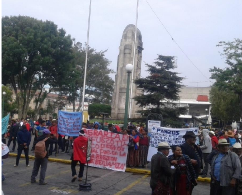
Figura No. 6 Marcha por la dignidad y justicia, Organizaciones Campesinas 30 de abril 2019, Quetzaltenango