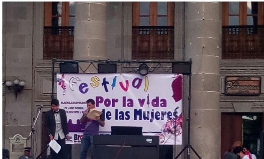
Figura No. 2 Conmemoración Día Internacional de la No Violencia. Quetzaltenango, 8 de marzo 2016

En estos tres sectores de la población guatemalteca, a partir de la década de los '70., se han protagonizado importantes movimientos sociales, todos ellos en la búsqueda de reivindicaciones de derechos, justicia y tierras.