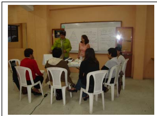
Grupo Focal con Alcaldesas Auxiliares