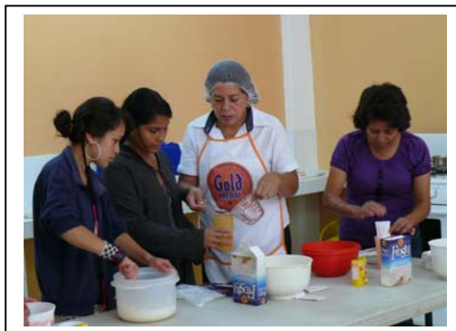
Capacitación a mujeres de parte de la Municipalidad de Santa Catarina Pinula