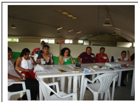
Fotografías: Lideresas comunitarias de Palencia, participantes en Grupo Focal Agosto 2010.