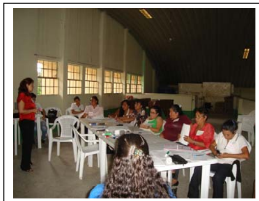
Grupo Focal Lideresas Comunitarias