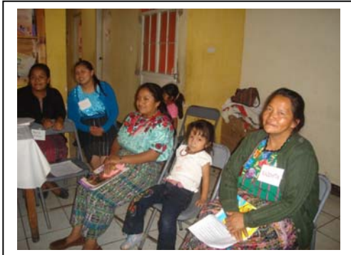
Grupo focal con integrantes de la Asociación de Mujeres Sanjuaneras –AGIMS-