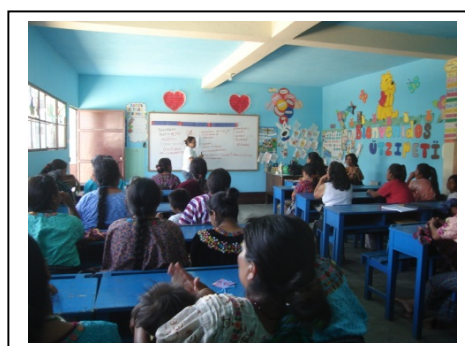
Fotografías: Capacitación en Aldea Montúfar, San Juan Sacatepéquez, sobre Participación Política de la Mujer, organizada por la OMM y SEPREM.