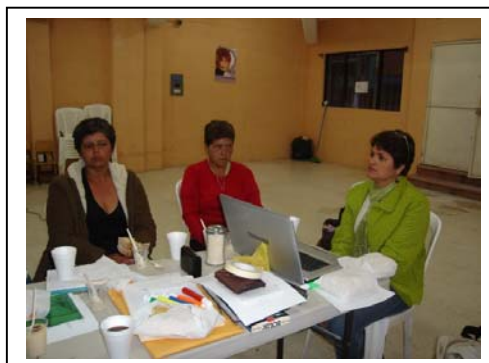
Fotografías: Reunión Focal con Alcaldesas Auxiliares. Agosto 2010.