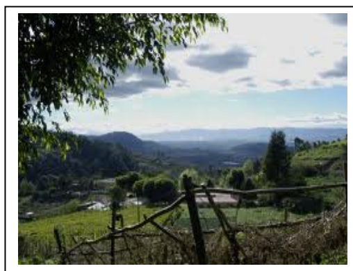
Vista Panorámica Palencia