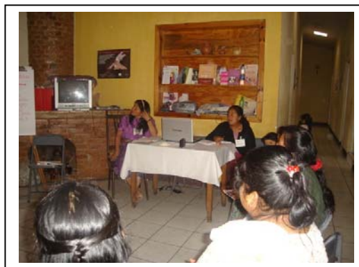
Fotografías: Sede e integrantes de AGIMS.