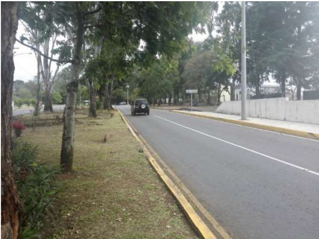
Boulevard sur de la Universidad de San Carlos de Guatemala