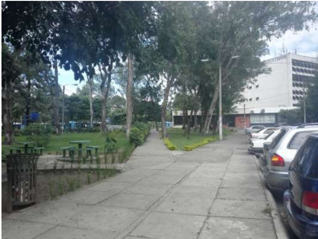
Caminamiento entre antiguo edificio de CALUSAC y Biblioteca Central