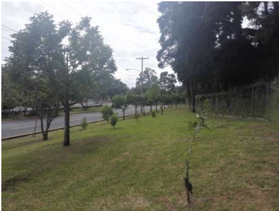
Parque Las Ardillas contiguo a boulevard principal frente a edificio T7 de la Facultad de Ingeniería