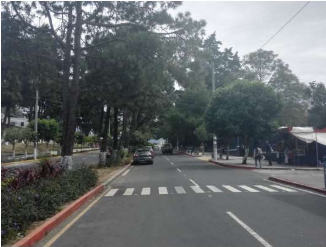
Salida de la universidad por avenida Petapa