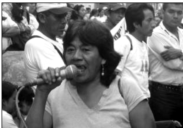
Movilización de Plataforma Urbana por una vivienda digna

“Creo que es una meta estar trabajando en este espacio, porque una a veces pasa por ciertos problemas familiares, en mi caso hasta eso vencí, aún estoy participando a pesar que en mi hogar me amenazaban, pero ya no tengo la presión y estoy trabajando libremente.”[E-1 San Pedro Ayampuc]