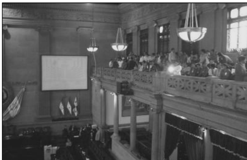
Presentación de Iniciativa de Ley 3869, Congreso de la República

“Para elaborar la agenda se tuvo que conocer los instrumentos legales que la fundamentan, las personas que participan en el proceso son impactadas de alguna manera, después del proceso se ve la realidad con otra visión, se tienen más argumentos para hacer planteamientos y propuestas”. [E-4 Chinautla]