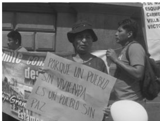
Plantón de Plataforma Urbana frente al Congreso de la República.

de urbanización que existen y se manifiestan en Guatemala, para que a la luz de esto empecemos a incidir en la solución de las problemáticas con nuevos paradigmas, metodológicamente el ejercicio de consulta, generación de debate y el involucramiento de las y los pobladores...” [E- 6 San Pedro Ayampuc]