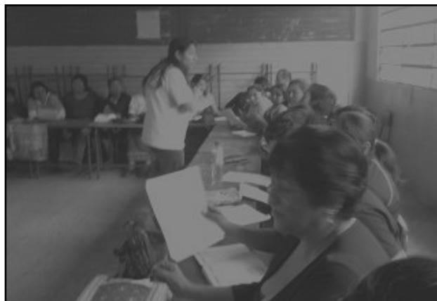
Grupo de Validación en Multisectorial de Chinautla

la información en relación a los avances de la investigación y participar en la dinámica de los espacios de coordinación a partir de la observación participante. Además se favoreció el vínculo DIGI-Plataforma Urbana a partir de la ejecución de este proyecto de investigación. Así pues se logró participar en 16 reuniones en total de las Multisectoriales de los cinco municipios y de plenaria de Plataforma Urbana.