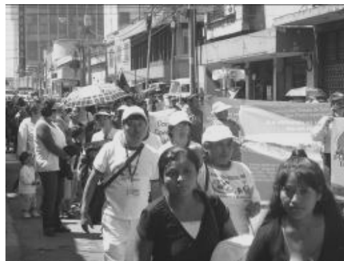
Participación en marcha por el Día del Hábitat

La participación de las y los comunitarios permite un aprendizaje que se va entretejiendo desde las experiencias individuales y colectivas que trasciende de lo local a lo regional; esto ha permitido posicionar a Plataforma Urbana como un referente político, convirtiéndose en un espacio que genera propuestas para la reivindicación de las áreas urbanas populares, concretándolo con un instrumento que evidencia las luchas comunitarias, Las Agendas de Desarrollo .