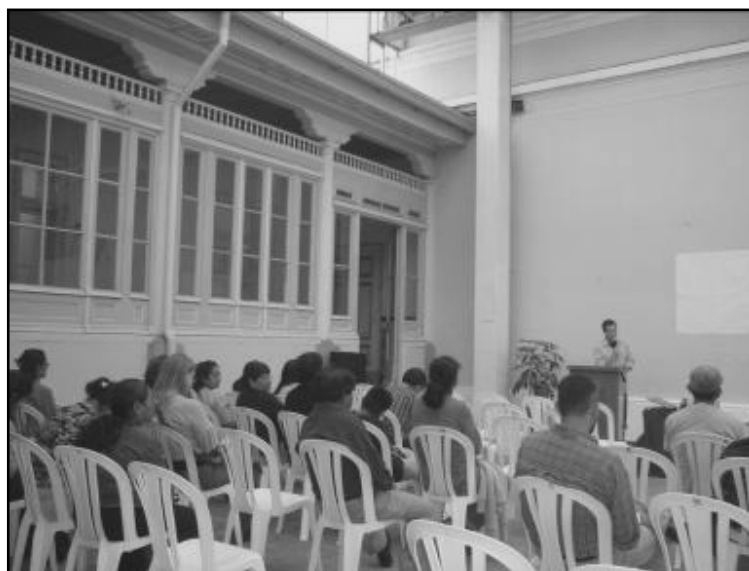
Presentación de la Sistematización en Casa Ibargüen el 29 de octubre de 2010.

pertenecen a ONG's, personas que laboran en las Municipalidades: de Chinautla y Guatemala, representantes de SEGEPLAN y autoridades de la Dirección General de Investigación (DIGI) y del Centro de Estudios Urbanos y Regionales (CEUR).