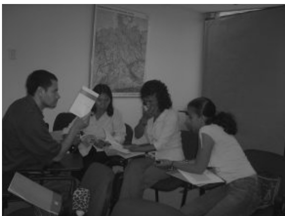
Formación política, mesa intermunicipal (Fundación Friedrich Ebert)

La mirada antes descrita es a partir de lo individual. En cambio hay también miradas colectivas que definen desde otra perspectiva lo que es una Agenda de