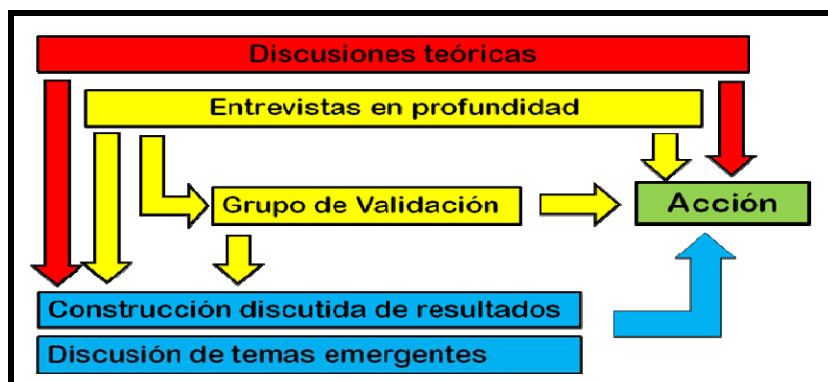
Diagrama 1: Los Tres Ejes de Trabajo

Para la realización de la investigación se tomaron en cuenta tres ejes básicos: