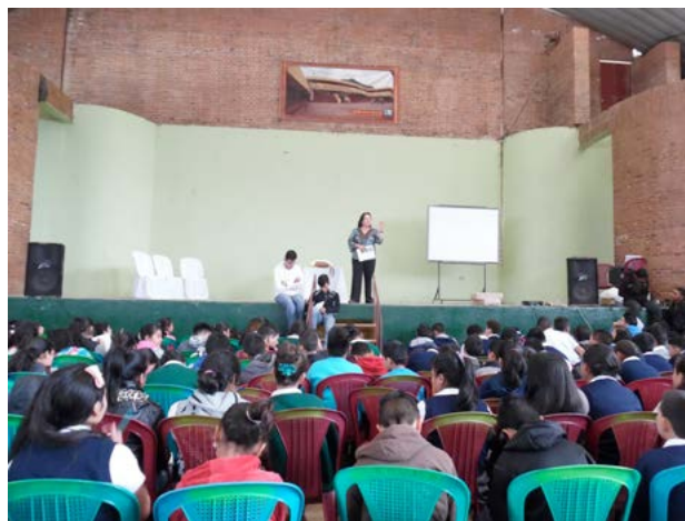
Presentación de la Revista Historia e Identidad del Pueblo Xinka en caserío Los González, Santa María Xalapan.

Esta actividad también se realizó el 15 de diciembre de 2015, en el Caserío Los González, aldea Sachicó, Santa María Xalapan, Jalapa; donde asistieron alrededor de 60 líderes campesinos, hombres y mujeres, de distintas edades, provenientes de la montaña de Santa María Xalapan. Es importante indicar que la actividad fue coordinada entre el Instituto de Estudios Interétnicos y el