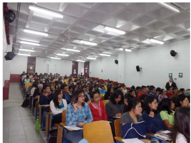
Estudiantes de la Escuela de Ciencia Política durante II Semana Académica de Investigación.

investigadores y estudiantes de la Escuela, así como de unidades de investigación de la Usac, de otras universidades y de organizaciones de la sociedad civil y de derechos humanos, tales como el Instituto de Investigaciones Políticas y Sociales (IIPS), el Instituto de Investigaciones Históricas, Antropológicas y Arqueológicas de la Escuela de Historia (IIHAA) la Dirección General de Investigación, el Instituto de Estudios Interétnicos (IDEI), la Facultad Latinoamericana de Ciencias Sociales (Flacso), la Asociación para el Avance de las Ciencias Sociales (Avancso), Plaza Pública, Instituto Centroamericano de Estudios Sociales y Desarrollo (Incedes), Geopolis, Neurona Política, Equipo de Estudios Comunitarios y Acción Psicoso-