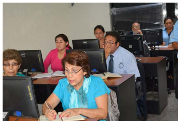
Participantes durante el curso de Tecnología Docente.

El curso se desarrolló en el laboratorio de la Unidad de Informática y Cómputo de la Dirección General de Investigación, con la