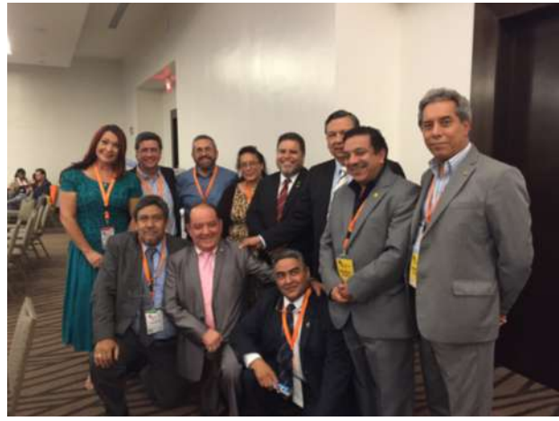
Autoridades de las universidades centroamericanas participantes en el VIII Congreso Universitario Centroamericano.