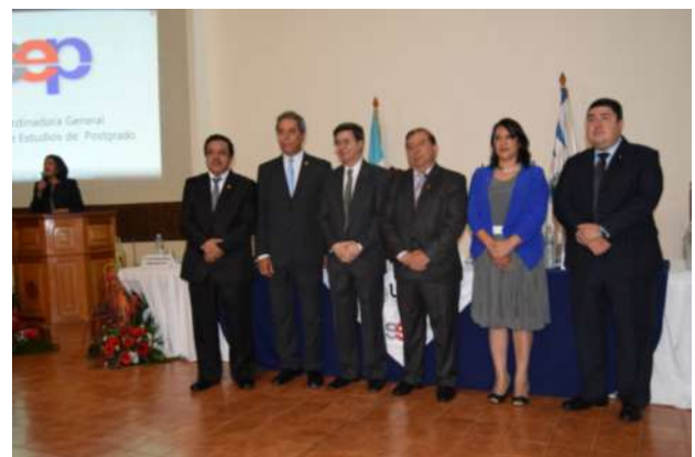
Consejo Directivo del SEP.

Las unidades académicas participantes fueron: Facultad de Ciencias Econó-