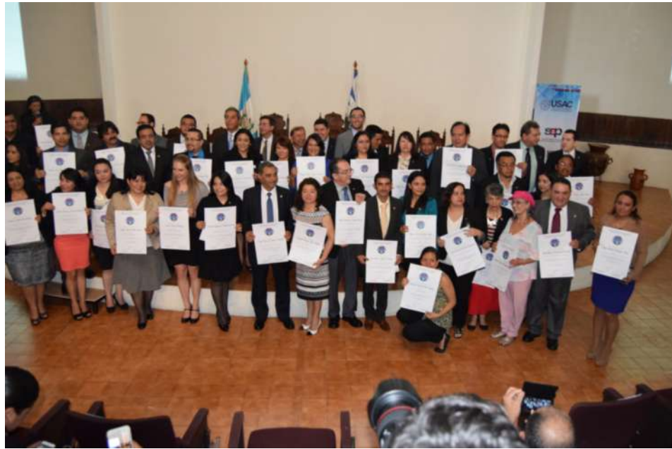
Homenajeados y miembros del Consejo Directivo de la Coordinadora General del Sistema de Estudios de Postgrado.