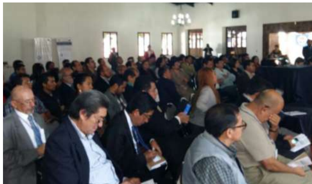
Público asistente al I Congreso Científico de la región suroccidente.