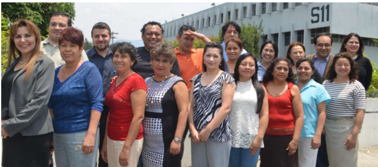
Personal administrativo de la Digi.

los académicos mencionados. Finalmente, el día 8 de julio, el Musac será el escenario de la actividad académica y cultural con el panel: “Horizonte temporal y prospectiva para el fortalecimiento y formación del capital humano, desarrollo de la ciencia, tecnología e innovación en el marco de las agendas de desarrollo y del Katún 2032: retos y desafíos”. La actividad académica reunirá a funcionarios del Consejo Superior Universitario de Centro América (Csuca), Secretaría General de Planificación (Segeplan), Organización de las Naciones Unidas para la Educación, la Ciencia y la Cultura (Unesco) y por supuesto, la comunidad académica y el gremio de investigadores de la Universidad de San Carlos y otras universidades del país invitadas.