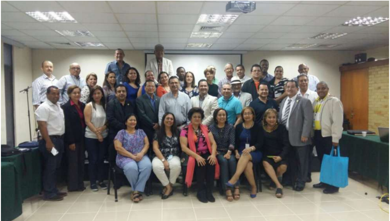
Autoridades y académicos de las universidades centroamericanas participantes en el VIII Congreso Universitario Centroamericano.