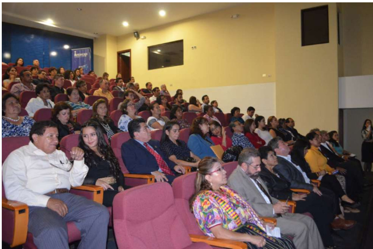
Público asistente a la firma de la carta de entendimiento entre la Facultad de Humanidades, la Escuela Superior de Arte, la Dirección General de Investigación de la Usac y el Museo Ixkik' del traje maya.