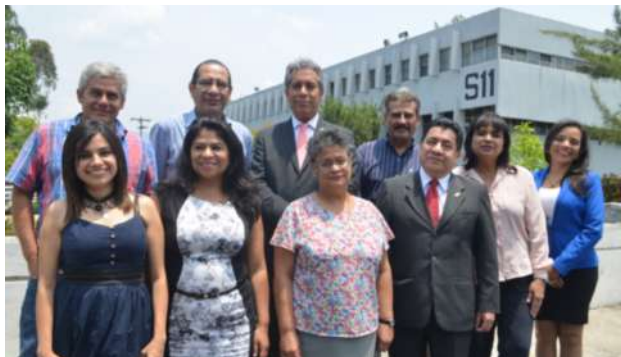
Autoridades y coordinadores de los programas universitarios de investigación de la Digi.

El 1 julio la Dirección General de Investigación arriba a sus 35 años de creación, por lo cual ha organizado una serie de actividades académicas y culturales, dirigidas a la comunidad universitaria y al público en general. El programa general de actividades incluye una exposición posters informativos, a través de los cuales se darán a conocer datos his-