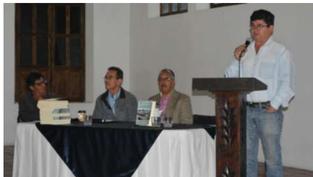
La delegación invitada de la Universidad Autónoma de Chiapas, tuvo participación también con la conferencia “Guatemala-Chiapas: economía y frontera”.