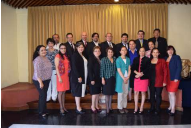
Autoridades del postgrado, docente y estudiantes de doctorado.

El día 21 de mayo, en un hotel de la ciudad capital se realizó la presentación del seminario de tesis III, de la corte del doctorado en educación de la Facultad de Humanidades. La actividad tuvo una duración de 9 horas. El seminario permite evaluar los niveles epistemológicos, teóricos y metodológicos alcanzados por el estudiante en la aplicación e