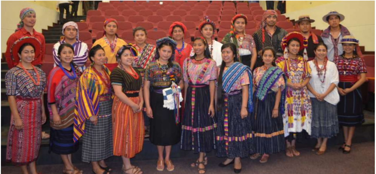
Grupo de jóvenes universitarios que realizó la presentación de trajes mayas a cargo del Museo Ixkik'.

El pasado 5 de mayo, la Facultad de Humanidades, la Escuela Superior de Arte, la Dirección General de Investigación de la Universidad de San Carlos de Guatemala y el Museo Ixkik' del Traje Maya, suscribieron una carta de entendimiento con la cual buscan proyectar la educación superior en su contexto pluricultural, multilingüe, y multiétnico, establecido en el Marco Filosófico del Plan Estratégico de la Universidad de San Carlos de Guatemala 2002-2022 y también lo establecido en el Acuerdo sobre Aspectos Socioeconómicos y situación agraria de los Acuerdos de Paz establece que "...la Universidad de San Carlos de Guatemala es