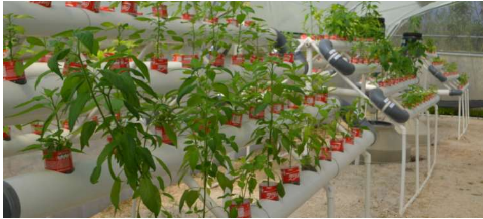
Invernadero acuapónico de la Facultad de Medicina Veterinaria y Zootecnia.

El viernes 20 de mayo en las instalaciones de la granja experimental de la Facultad de Medicina Veterinaria y Zootecnia, fueron presentados los avances del proyecto: “Adaptación y rendimiento de variedades de chile nativas de Guatemala en un sistema acuapónico con tilapia nilótica” co-financiado por la Dirección General de Investigación.