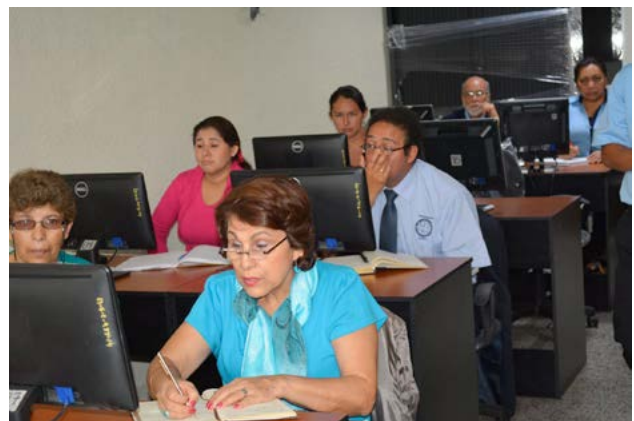
Participantes durante el curso de Tecnología Docente.

El curso se desarrolló en el laboratorio de la Unidad de Informática y Cómputo de la Dirección General de Investigación, con la